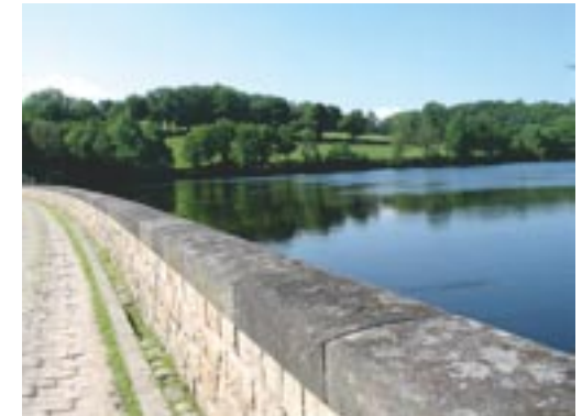
La digue des Gannes

Le Barrage des Gannes constitue le réservoir en eau potable des commentryens.